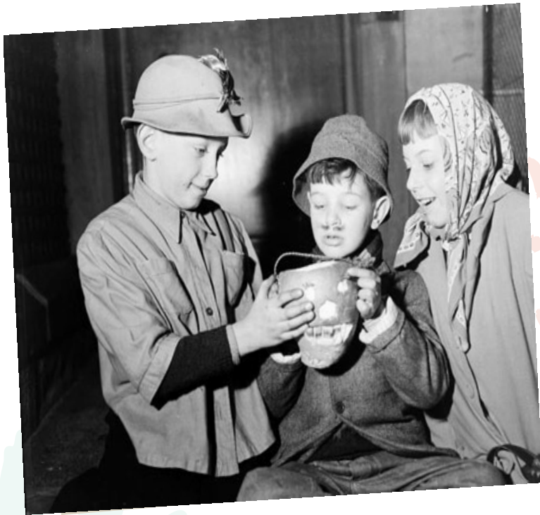
Title: Guisers warm their hands over their tumshie lantern. Scran ID: 000-000-058-201-C